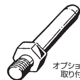
オプション品： 取り付けアーバー