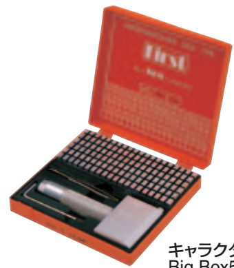
キャラクター Big Box5mm

1940年創業以来、50ヶ国に輸出、金属加工業界はむろん世界中の多くの分野で高い評価を得ています。60年以上の歴史と実績に裏づけられた品質、オートメーターチップ用特殊鋼の採用と正確な熱処理により抜群の耐久性・高精度で明確な刻印、サイズを保証します。カセットテーキン“キャラクター”はプラスチックケースに入っており携帯保管に大変便利です。手打ちアーバーから取付アーバーに替えれば、トスマック・インパクトプレスに取付けられます。